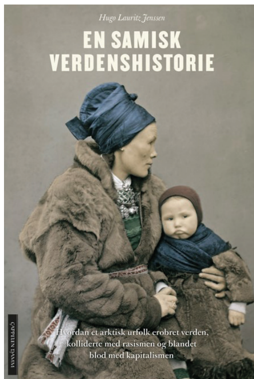
En samisk verdenshistorie ble omstridt på grunn av kildebruken.

til motstanderne ryddet av veien. Men diskusjonen var langt fra over.