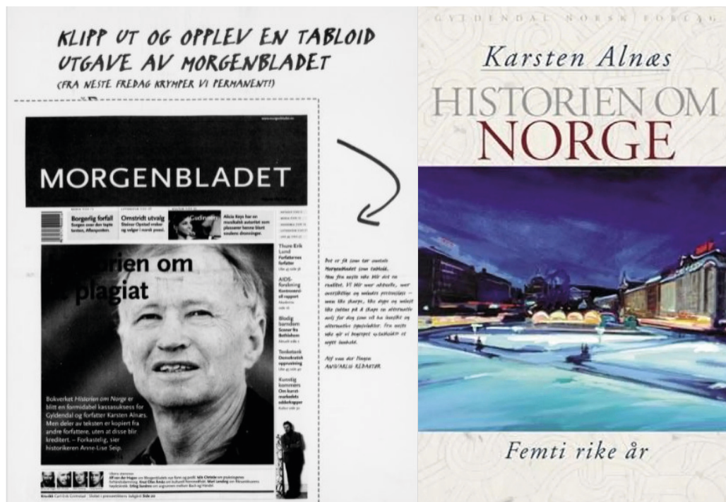
Faksimile av Morgenbladets forsider 7. november 2003, med starten på det som skulle bli «Alnæs-debatten». Avisen benyttet samtidig sjansen til å markere at den var i ferd med å krympe formatet. Til høyre den siste boken i fembindsserien.

saken fra 2010 7 og Rolfsen-saken fra 2015 8 . Vi tar ikke for oss rettsreglene og hvordan disse skal praktiseres overfor sakprosa, men en del rettsavgjørelser er viktige for å forstå problematikken rundt denne typen tekster. Rolfsen-saken, om en dokumentarfilm, illustrerer blant annet at diskusjonene vi trekker opp her, også kan gjelde andre typer dokumentarisk arbeid, som film, noe vi berører senere i artikkelen. 9 Den over 30 år gamle Edderkopp-saken illustrerer at noen av spørsmålene som berøres, egentlig strekker seg enda lenger tilbake enn til tusenårsskiftet. Rettspraksis kan også brukes til å reflektere over en fremtidig utvikling, og avslutningsvis trekker vi derfor inn noen relevante dommer fra Den europeiske menneskerettsdomstolen (EMD).